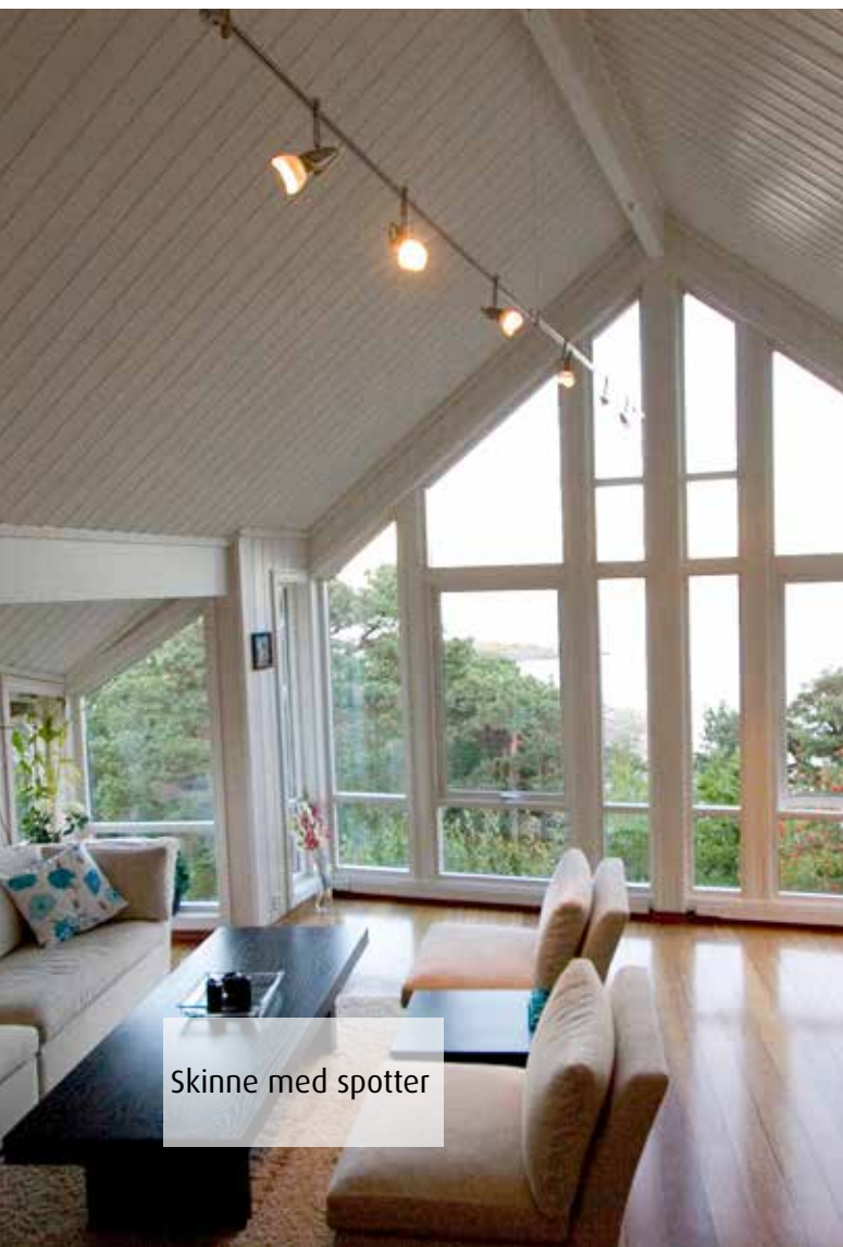
Skinne med spotter